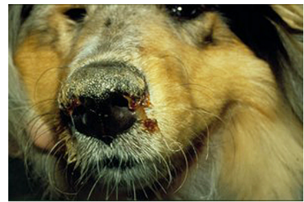
An Staupe erkrankter Hund mit eitrigem Nasenausfluss und Hyperkeratose des Nasenspiegels